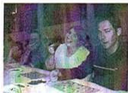
Des joueurs acharnés...